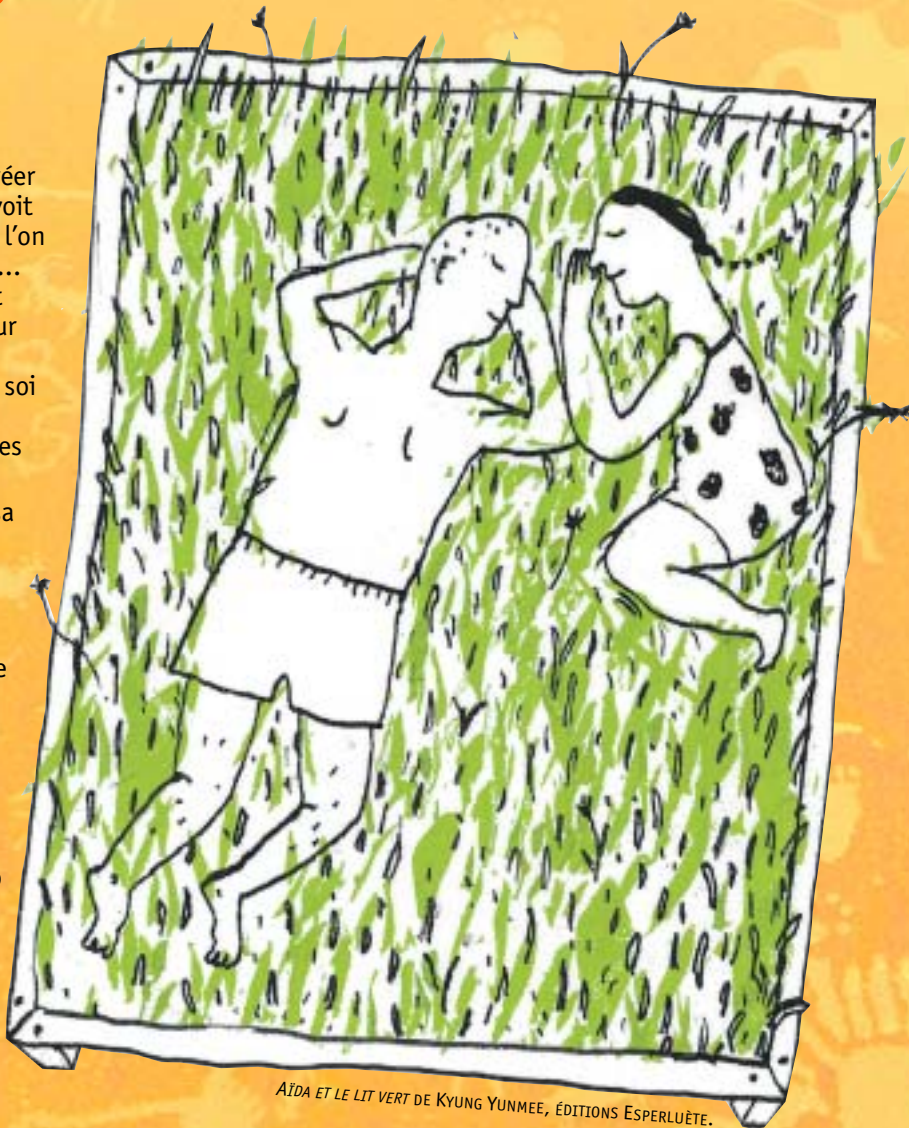
AÏDA ET LE LIT VERT DE KYUNG YUNMEE, ÉDITIONS ESPERLUÈTE.

Voir rubrique Images d'artistes , p. 22.